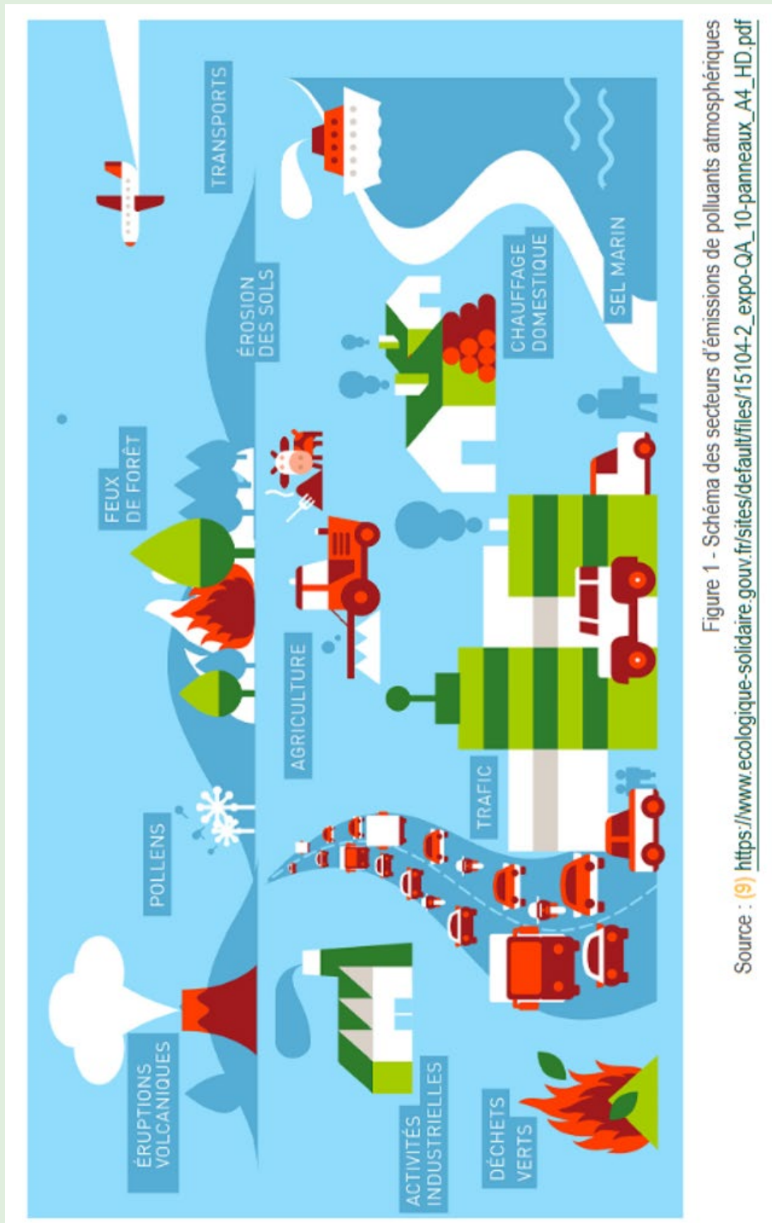
Figure 1 - Schéma des secteurs d'émissions de polluants atmosphériques